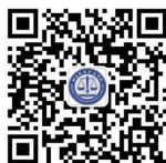
北京政法职业学院 官方微信